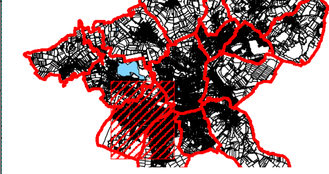
Schéma d'assemblage :

Réalisation : Date: 2010/05/04 Élaboré par: MB Contrôle par: FC Modification : Date : Dessiné par :