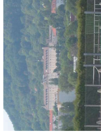
Vue lointaine du site de l'ancien hôpital