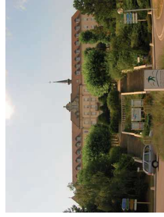
Perspective sur le bâtiment principal