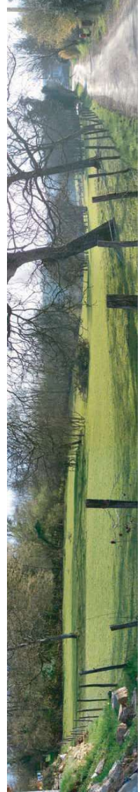
Vue 1 : Secteur Nord depuis la rue de la Vie De Saulx