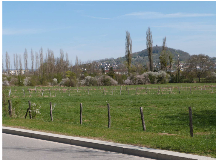
vues sur le secteur depuis la RD 474 et depuis le village d'Echenoz.